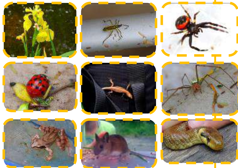
Photos prises au cours d'une séance de terrain

NB : La formule-journée ci-dessus n'est qu'une proposition, modulable selon vos attentes pédagogiques, ou vos contraintes. Les horaires (matin/après-midi) sont donnés à titre indicatif, les ateliers pouvant facilement être intervertis pour vous permettre de venir à deux classes.